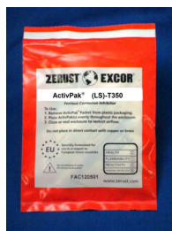
アクティブパック LS-T350・LS-T330