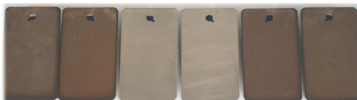
他社製気化性防錆材 アクティブパック 35 安息香酸アンモニウム