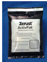
アクティブパック 35