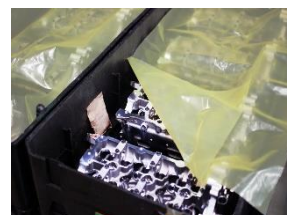
Zerust®フィルム(カットシート) とアクティブパック併用例