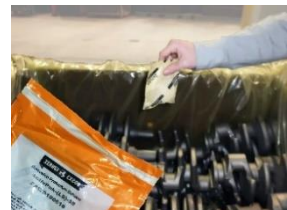
Zerust®フィルム(ガゼット袋)と アクティブパック併用例