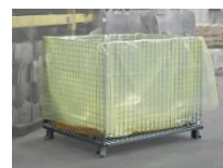
W1/W2 用 MYF-HS ガゼット袋

フィルム単独では、心細いと感じる方には、フィルムと固形薬剤の併用をお勧めします。初期防錆重視の場合は、アクティブシリーズ(鉄・アルミ用)、長期防錆効果重視の場合は、Cor-TAB(鉄・非鉄両用)など、材質・容積・用途に合わせた製品を、ご用意しています。