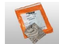
← アクティブパック ✓ Cor-Tab ↓ Cor-Tab 実装例